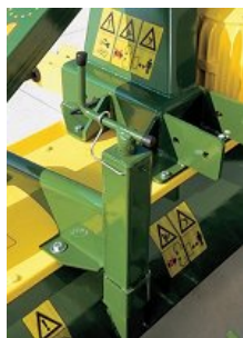
Zadnja prečka podesiva pomoću dva hidraulična cilindra