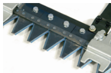
Kosilni grebeni Europa:

Če je bilo "srce" kosilnic izdelano, da je vedno pripravljeno in učinkovito, morajo biti tudi kosilne naprave sposobne in učinkovite, da je pri slehernemu obdelovanju njih rez dovršen in hiter brez kopičenja ter da ne potrebujejo vzdrževanja.