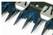
Kosilni greben s srednjegostimi zobmi:

Širine na razpolago 80 - 100 - 115 in 135 cm. Ti proti- zamašitveni kosilni grebeni se svetujejo če so trave trde in ostre, značilne za planinske pašnike in boljše travnike. Na razpolago so s vzmetnimi pritiskači, da se omejijo nastavljanja in izboljša rez in učinkovitost. Odsvetuje se uporaba na zanemarjenih zemljiščih in v prisotnosti kamenja.